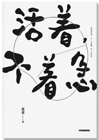
《活着，不着急》 苏童 中信出版社 2019年9月